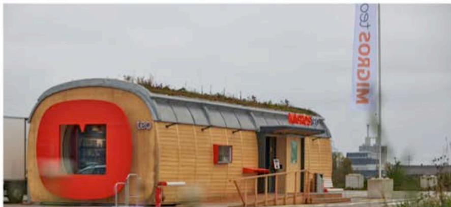
Die Migros testet im Kanton Thurgau einen Supermarkt ohne Verkaufspersonal.